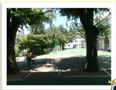
大きなけやきの木の下は木陰がいっぱい