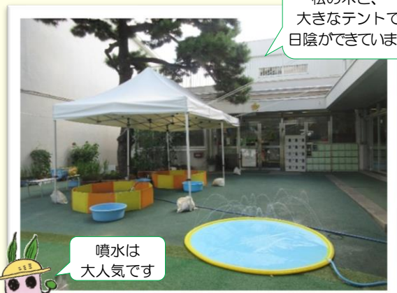
噴水は大人気です

◆お願い◆ 自転車は、希望の坂の塀側の、道路の上下に引いてある白線の間に、塀によせて置いてください。