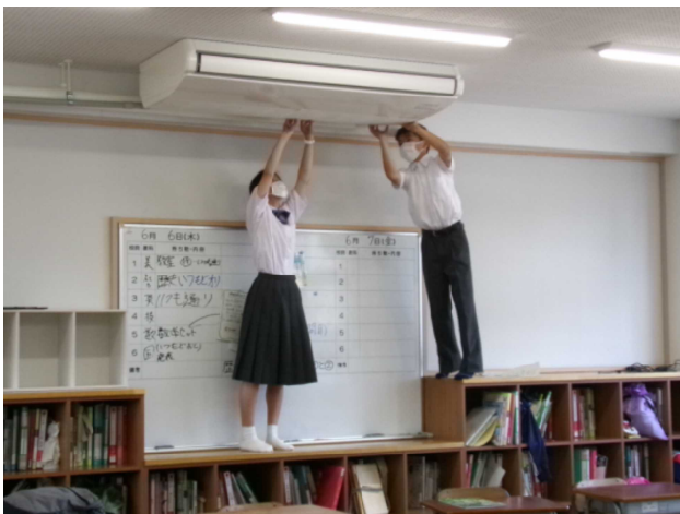
6月5日(水) 生徒委員会(環境委員)