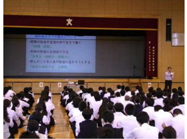
6月3日(月) 全校朝会 校長講話