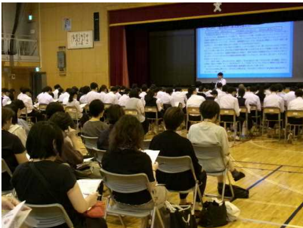
6月7日(金) 進路説明会