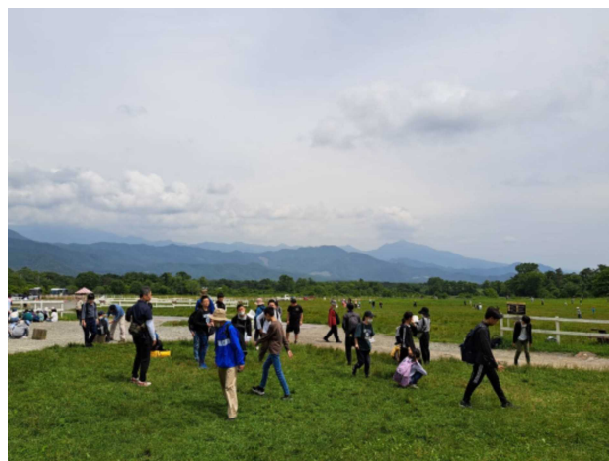
6月27日(木) 特別支援学級八ヶ岳合同宿泊学習