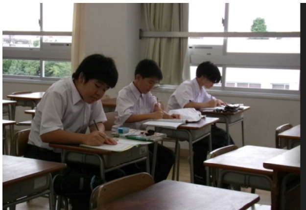
6月24日(月) 放課後 自習室