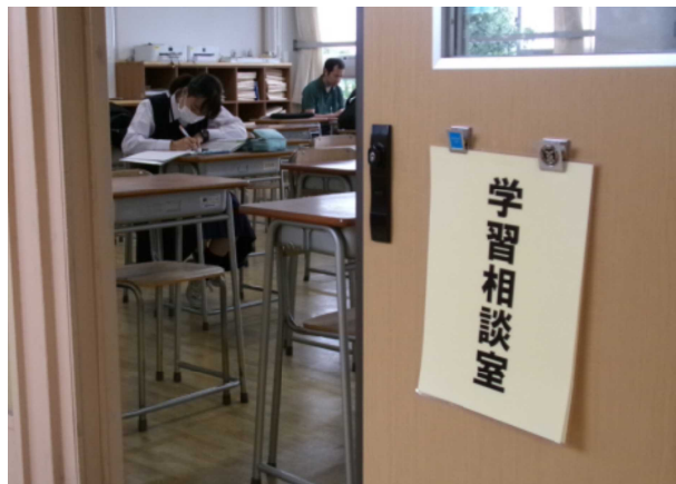
6月24日(月) 放課後 学習相談室