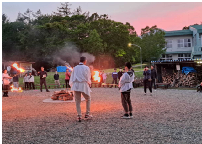
6月26日(水) 特別支援学級八ヶ岳合同宿泊学習