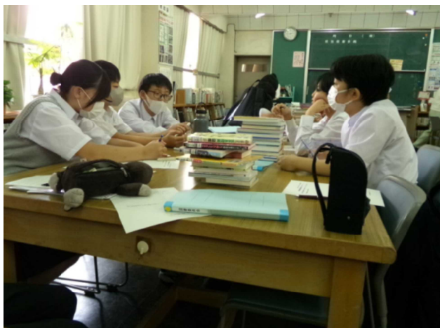
7月3日(水) 生徒委員会(図書委員会)