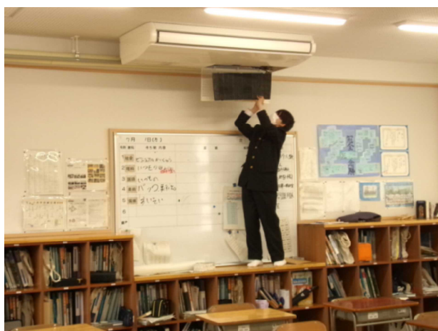
7月3日(水) 生徒委員会(環境委員会)