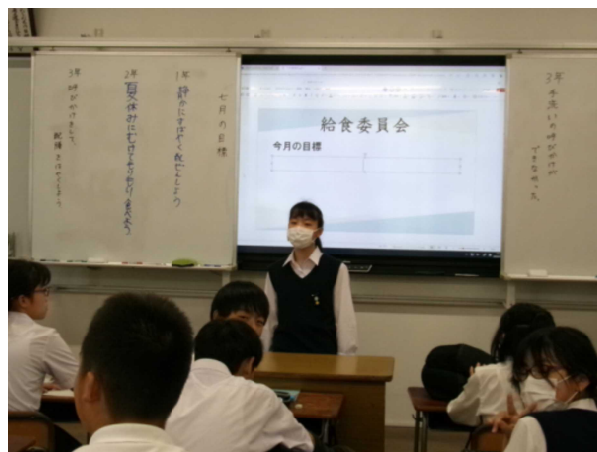
7月3日(水) 生徒委員会(給食委員会)