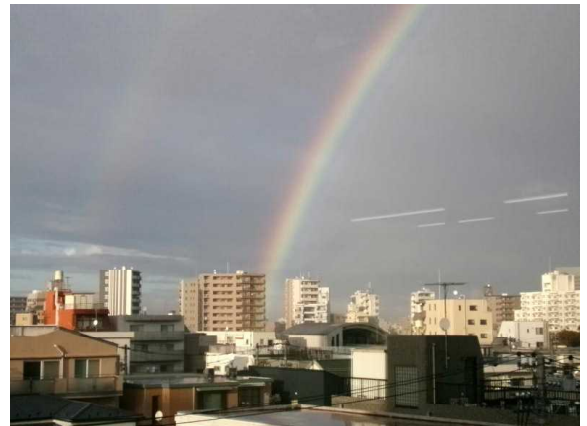
11月21日（木）きれいな虹が出ました！