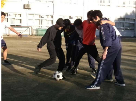
12月10日(火) ランランクラブ