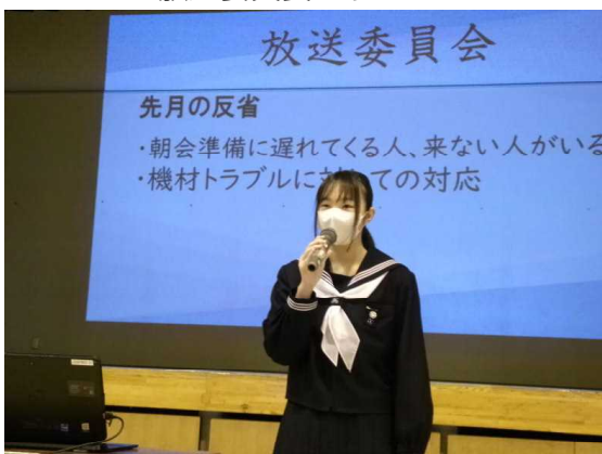
12月9日(月) 生徒会朝会(委員長報告) 放送委員長より