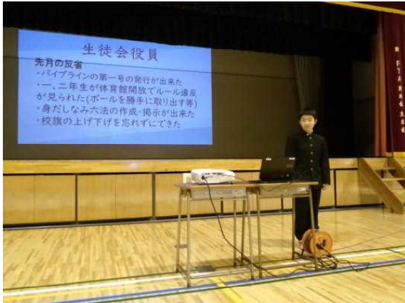
12月9日(月) 生徒会朝会(委員長報告) 生徒会長より