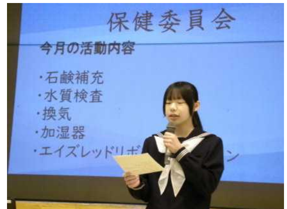
12月9日(月) 生徒会朝会(委員長報告) 保健委員長より