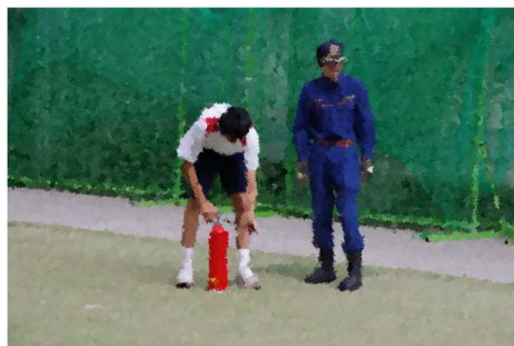
【初期消火訓練】手順を間違えずに、目標をしっかりと狙って消火！