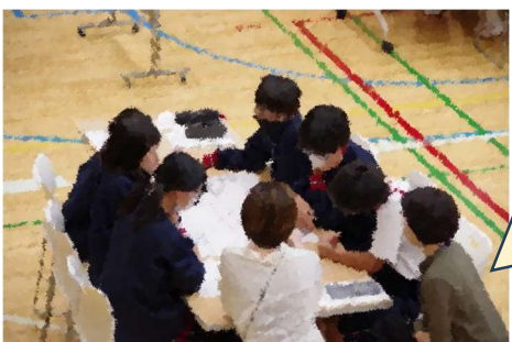
【HUB】避難所をどのように運営したらよいか、考え、決断する機会です。