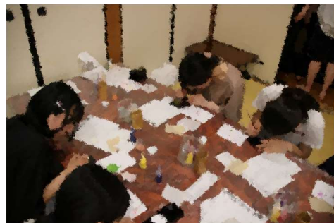
【絵付け体験】一生懸命カキカキしている姿が、皆とても尊いものでした。