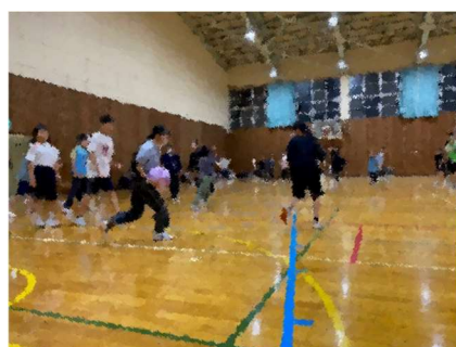
【学年レク】夜は2日間ともレクで親睦を深めました(クラス対抗ドッジボール)