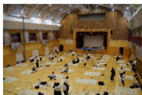
【就寝準備】男子はアリーナに、女子は各教室で訓練後の体を休めました。