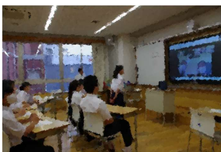
【意見交換】お互いの学校紹介や戦争・平和についての意見交換を行いました。

6月21日(金)に、2学年の代表生徒が、沖縄県うるま市立与勝第二中学校の生徒とWEB会議により交流会を行いました。