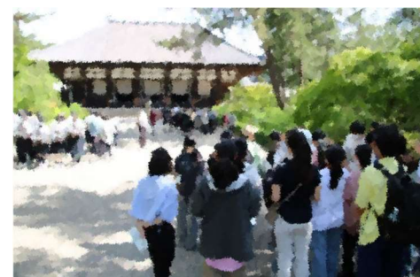
【3日目バス行動】奈良の各地を巡り、クラスの思い出も作る事ができたようです。