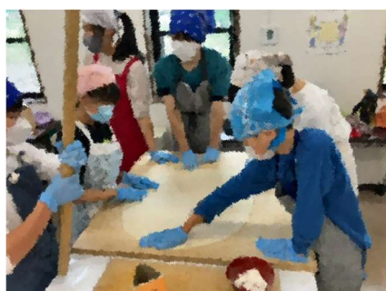
【ほうとう作り体験】みんなで一生懸命こねて、麺棒で大きくのばしました。

6月24日(月)から26日(水)にかけて、1学年の八ヶ岳移動教室が実施されました。2日目には登山も無事行われ、3日間を通して1年生は個人・集団としての力を身に付けてくれました。