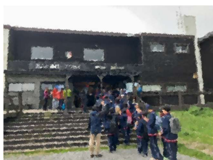
【ロープウェイ駅】ロープウェイで絶景を見ながら揺られて下山しました。