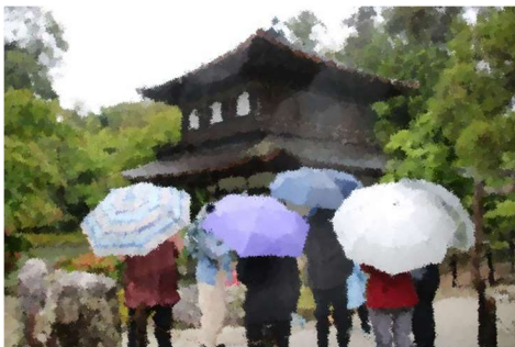
【1日目夕ヶ行動】強烈な雨にも負けず、安全第一でしっかり学んできました。