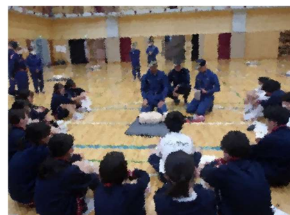
【救命訓練】心臓マッサージについての説明をしっかりと聞き取っています。