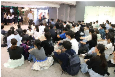
【出発式】楽しみで仕方ない気持ちがひしひしと伝わってきました！

5月28日(火)から30日(木)に京都・奈良方面への修学旅行に行ってきました。最上級生として立派に学び通すことができました。