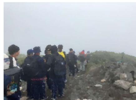
【無事登頂!】景色は絶景!ではなかったですが、全員頑張って登頂しました。