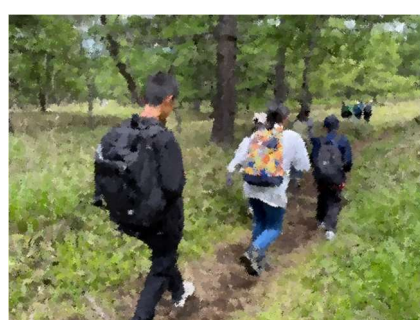
【オリエンティング】地図とコンパスを頼りに、協力してポイントをまわります。

本校ではさまざまな行事が行われており、生徒の皆さんは積極的に参加しています。生徒たちが楽しみにしている行事を通して、多様な資質・能力を身に付けていけるように教職員一同努めてまいります。