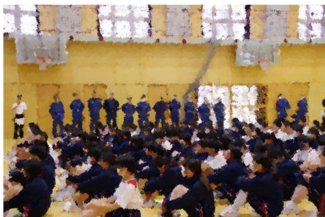
【体験開始！】消防署・消防団の皆さんの協力のもと体験活動を行いました。

6月7日(金)・8日(土)に本校において2学年の防災宿泊訓練が実施されました。防災についての実践的な体験活動を行うことができました。