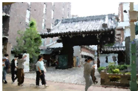
【朝散歩】きりっとした空気の中で、宿のすぐそばにある本能寺を訪れました。