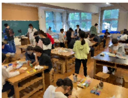
【木工体験】現地の木や実を使って、一人一人が思い思いの作品を作りました。