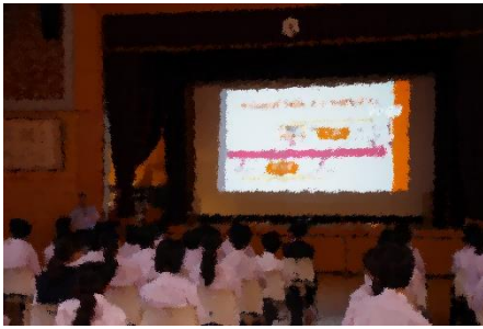
【全体講話】 遠い歴史になりつつある戦争。でもそれをまず知ることが大切。