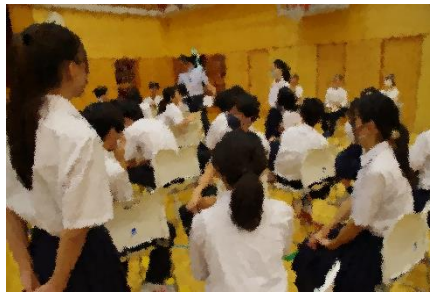
【意見交換】 過去の事実を知り、今の自分に何ができるかを考えました。

7月9日(火)に2学年対象に、平和について校長講話を行いました。2学年は沖縄に平和特派員として2名が参加しますが、その学びを広げるプロジェクトチームも結成されています。