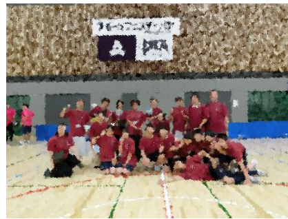
【記念撮影】 生徒も大人も競技・応援にと和気あいあいとなった一日でした。

7月13日(土)に、PTA 連合会主催のスポーツフェスティバルが行われ、本校からも11名の生徒が参加しました。誰でも楽しめ、かつ戦略性に富みエキサイティングなポッチャが新たな種目として実施されました。生徒たちは「ポッチャ面白い！」「こんなにエキサイトするとは！」ととても楽しんだ様子でした。