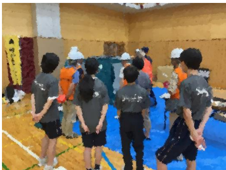
【避難所運営】 避難所で使用される運営キットの使用について学びました。