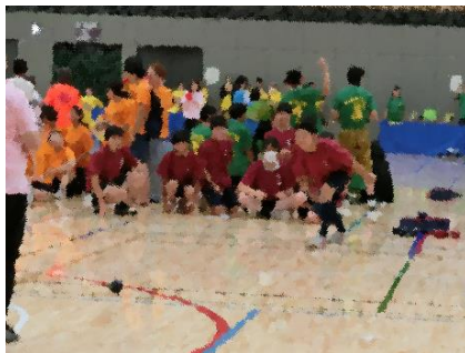
【緊張の一投】 狙いを定めてうまくボールを置けると最高の気分です！