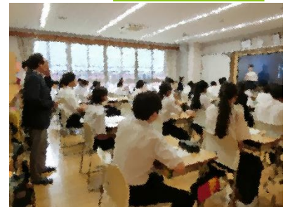
全学年の授業を参観いただきました。

協議会では校長や各主任から、学校状況や実施された学校行事、また生徒ボランティアの参加等について説明がありました。意見交換では、特にいじめ未然防止について活発な意見交換が行われました。