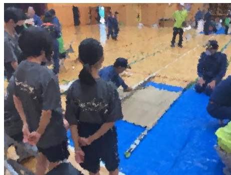
【応急担架】 毛布で応急の担架を作り、その使用感を確かめていました。

7月14日(日)に、本校アリーナで向丘地区町会連合会の防災訓練が実施され、多くの地域の皆さんが参加されました。