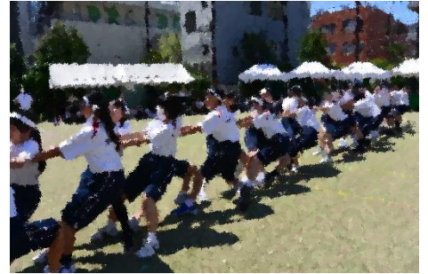
【綱引き】見ているこちらにも力が入ってしまう奮闘ぶりでした。