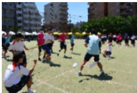
【部活動対抗リレー】各部のアイデアを生かした走りっぷり(?)が楽しかったです。