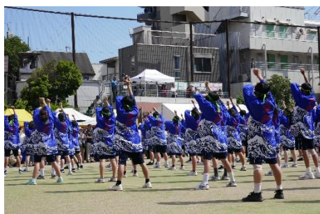
【全校ソーラン】きびきびとした素晴らしいパフォーマンス！Excellent！