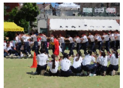
【3年学年種目】最後のチームをみんなまで拍手で迎える姿が感動的でした。