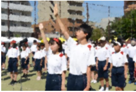
【開会式】大変すがすがしく、さわやかで好感がもてる選手宣誓でした。

5月18日(土)に晴れやかな天候の下、運動会が行われました。六中生の躍動ぶりの1コマをご覧ください。