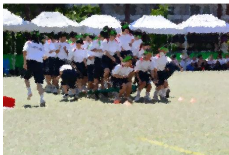
【2年学年種目】仲間と工夫し、全力を尽くした姿は、さすが上級生の姿でした。