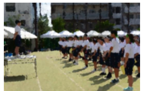
【閉会式】実行委員長の思いあふれる言葉に見ている側もグッときました。

生徒一人一人の頑張りにより、たくさんの素敵なおコマにあふれていました。勝利に向けて全力で臨む姿も素晴らしかったですが、一つの目標に皆が団結し、準備から本番まで精一杯取り組むそのプロセスが尊く、校長として大変誇りに感じる運動会でした。また保護者・PTA、地域学校協働本部の皆様には、運営にご協力いただき改めて感謝申し上げます。