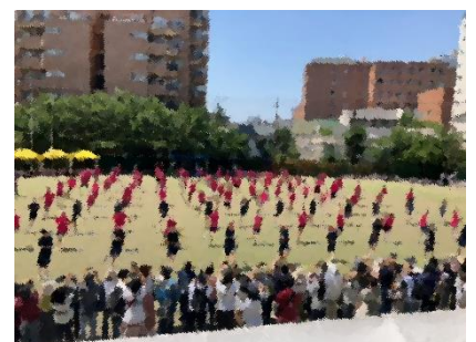
【ダンス】息の合った美しいダンスに感動で袖を濡らした先生もいたようです。