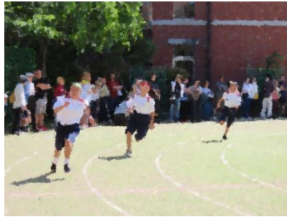
【1年100m走】初めての運動会。全力疾走する姿が素晴らしい！