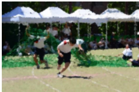
【走れメロス】障害物を懸命に乗り越えていく姿がほほえましかったです。