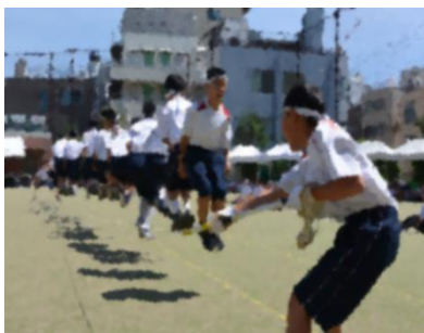
【1年学年種目】本番で最高のパフォーマンスを示すところが度胸満点！