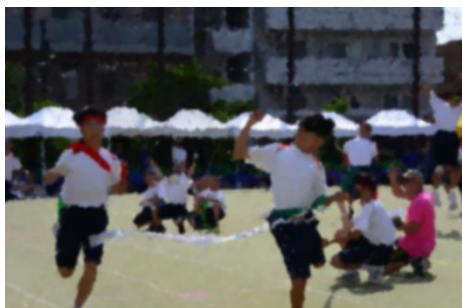
【色別対抗リレー】選抜選手の力強い走りが迫力満点でした。