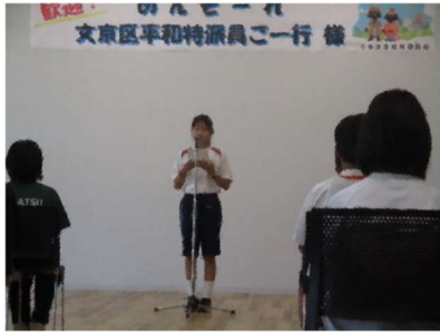
【対面式】本校の***さんが代表としてあいさつを行いました。

校内で学びを広げるプロジェクトチームが本校2学年で結成されていますが、11月の学習発表会では発表の場も設ける予定です。多くの六中生が平和への意識を向上させることを期待しています。