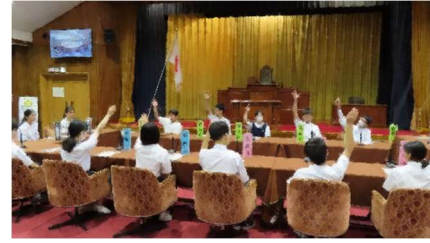
【参議院特別プログラム】