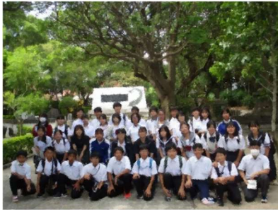
【ひめゆりの塔】千羽鶴を奉納し、平和への祈り・誓いを捧げました。