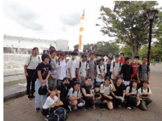
【筑波サイエンスツアー】