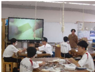
【音あんどん】づくり

本校では、夏季休業期間中に、「基礎学力の定着を図るとともに学習意欲の向上を図る」「各種プログラムを通して知的好奇心を育む」ために、夏期チャレンジプログラムを実施しています。今年の夏も、全教員の様々な工夫により、長期休業中しかできない魅力あるプログラムが計画され、たくさんの生徒たちが参加して実施されました。活動の一端を写真でご覧ください。