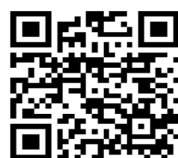
▲「教室・講座」 申込フォーム一覧

☎ (5800) 2591（平日・土曜 午前8時30分～午後5時） ホームページ： http://www.bunkyo-ky.ed.jp/ed-center/