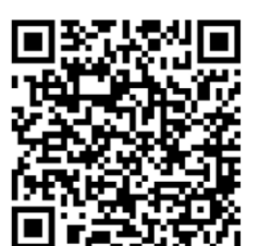
▲教育センター ホームページ