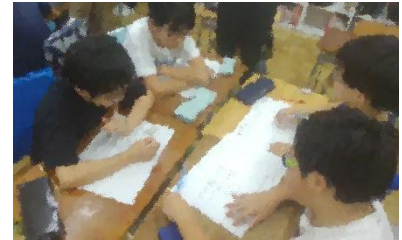
(5年生 校内研究授業の様子)

よりよい学びへと高めるためには、自ら課題を定め、知っていることや体験して学んだことを表現するだけでなく、友達と意見を交わし合い、相談し、時には相手の思いや考えを受け止め調整したりするなど、子どもたち自身が自分の学びを主体的にコントロールする力の向上が大切だと、文部科学省をはじめとする関係機関から示されています。これは「自己調整学習」とも言われ、本校においても今年度の校内研究のテーマの1つとして取り組んでいるものです。課題に対して、見通しをもち、計画を立て、実行し、振り返る活動を、1つの教科の学習だけでなく、生活科や総合的な学習の時間などの時間を活用して、教科横断的に行っています。このような学習を繰り返し行っていく中で、子どもたち1人1人の資質・能力を高めていければと考えています。