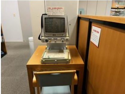
（文字を大きくする機械）