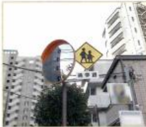
㉘カーブミラーと標しき